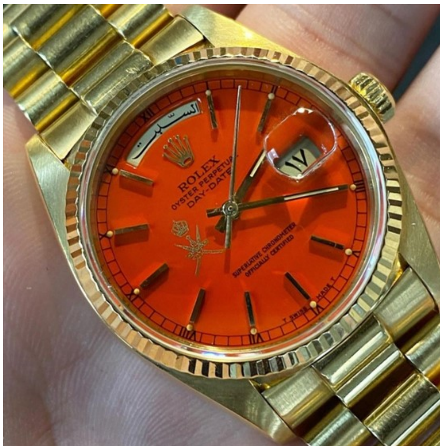
Stella rosso con Khanjar

Dunque, a differenza di Patrizzi o Pepsi , il termine Stella non è un soprannome dato dai collezionisti, ma un nome ufficiale. Proviene dalla " Stella SA ", un'azienda di Châtelaine che forniva pigmenti e le lacche ai fornitori di Rolex.