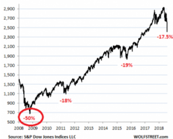
Small-Fry Sell-Off so Far S&P 500 Index Daily, Over Time

E poi la notorietà di grossi nomi come Uber (valutata oggi oltre 100 miliardi di dollari ), Palantir ( 41 miliardi ), Lyft ( 15 miliardi ), WeWork ( 45 miliardi ), Airbnb ( 31 miliardi ) o Peloton ( 4 miliardi ), dovrebbe facilitare la quotazione di molte altri titoli “tecnologici” (che potrebbero trovare nei primi la loro pietra di paragone) a aiutarli a superare l'ostacolo della diffidenza del mercato.